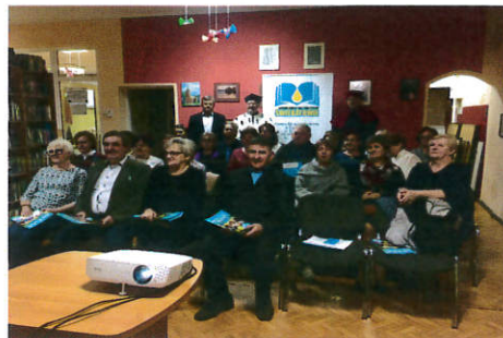
UTW – inauguracja nowego roku