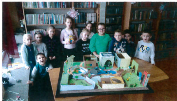
Ferie w bibliotece