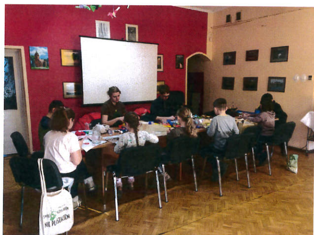
Ferie w bibliotece