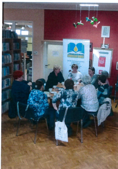
Dyskusyjny Klub Książki dla Dorosłych