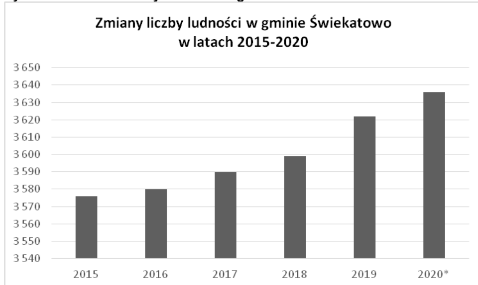
Rysunek 3 Zmiana liczby ludności w gminie Świekatowo w latach 2015-2020

Źródło: opracowanie własne na podstawie danych GUS