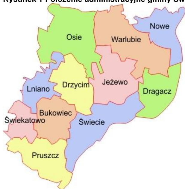
Rysunek 1 Położenie administracyjne gminy Świekatowo