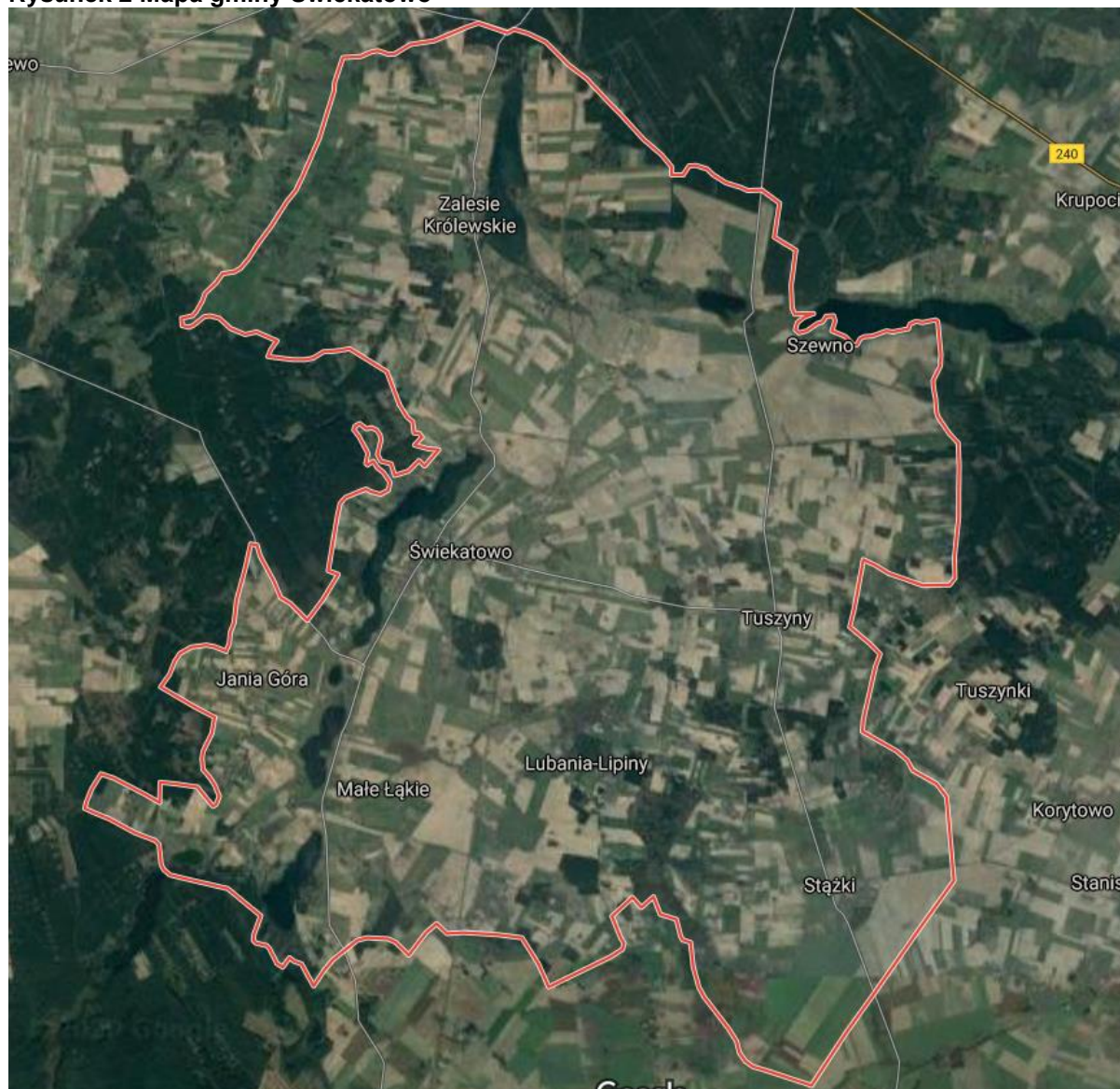
Rysunek 2 Mapa gminy Świekatowo

Klimat na terenie gminy oraz terenów sąsiednich kształtowany jest pod wpływem ścierających się mas powietrza kontynentalnego i polarnomorskiego. Średnia roczna temperatura powietrza wynosi 6,8°C, latem 13,4°C, a zimą 0,5°C. Suma rocznych opadów atmosferycznych dochodzi do 559mm. Przeważają wiatry z kierunków południowo-zachodniego i zachodniego. Podział W. Heinzeego i D. Schreibera na strefy klimatyczne Polski teren opracowania leży w strefie 6b od temp średnich -20,5°C do temp 17,8°C.