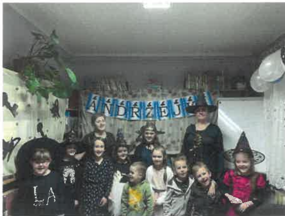
Andrzejkki w Klubie Mola Książkowego

Udostępniamy lokal dla Agenta Ubezpieczeniowego PZU. Gminna Biblioteka Publiczna w Świekatowie współpracuje z Towarzystwem Rozwoju Gminy Świekatowo, Orkiestrą Dętą OSP w Świekatowie, sołectwami z Gminy Świekatowo. GBP w Świekatowie jest również członkiem Lokalnej Grupy Działania Gminy Powiatu Świeckiego.