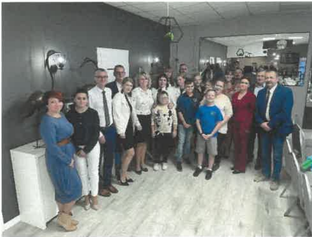
Spotkanie podsumowujące projekt aktywizujący dla dorosłych.