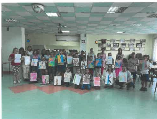
Spotkanie podsumowujące projekt „Wakacje Marzeń z biblioteką”