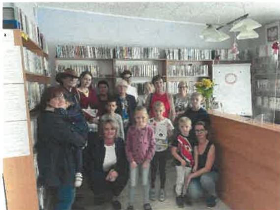
Wakacyjny Konkurs Czytelniczy