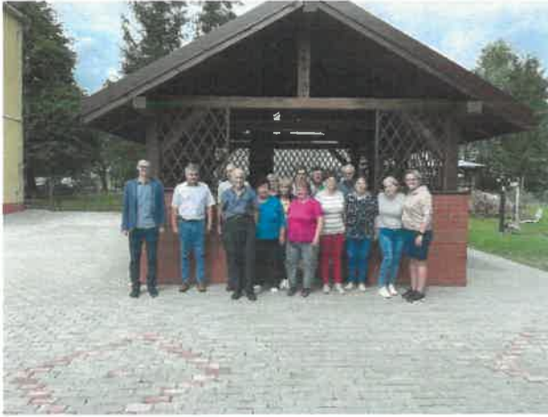
Spotkanie podsumowujące projekt dla Seniorów