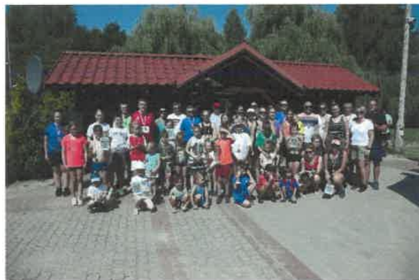
Leśny Bieg Świekatowski